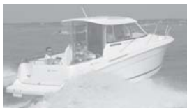
Merry Fisher 655