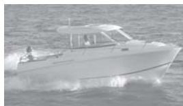
Merry Fisher 705