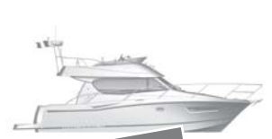
Merry Fisher 10