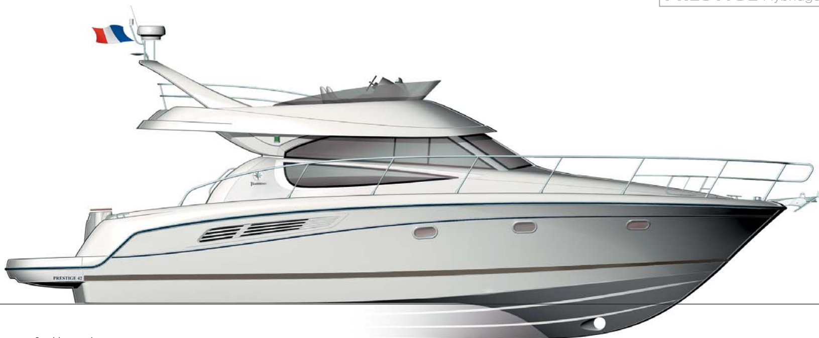
2 cabins version